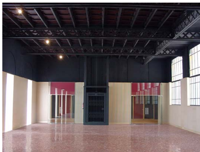
INTERIOR SALA USOS MÚLTIPLES