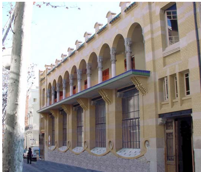
FAÇANA C/ INDÚSTRIA